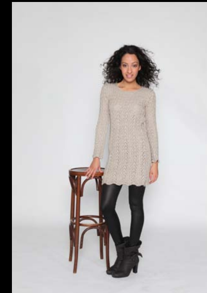
Die Cashmere Queen aus Natur - belassendem Cashmere

Sie haben Interesse an einer Premium Partnerschaft und möchten mehr Wissen? Bitte gehen Sie dazu auf die nächste Seite.